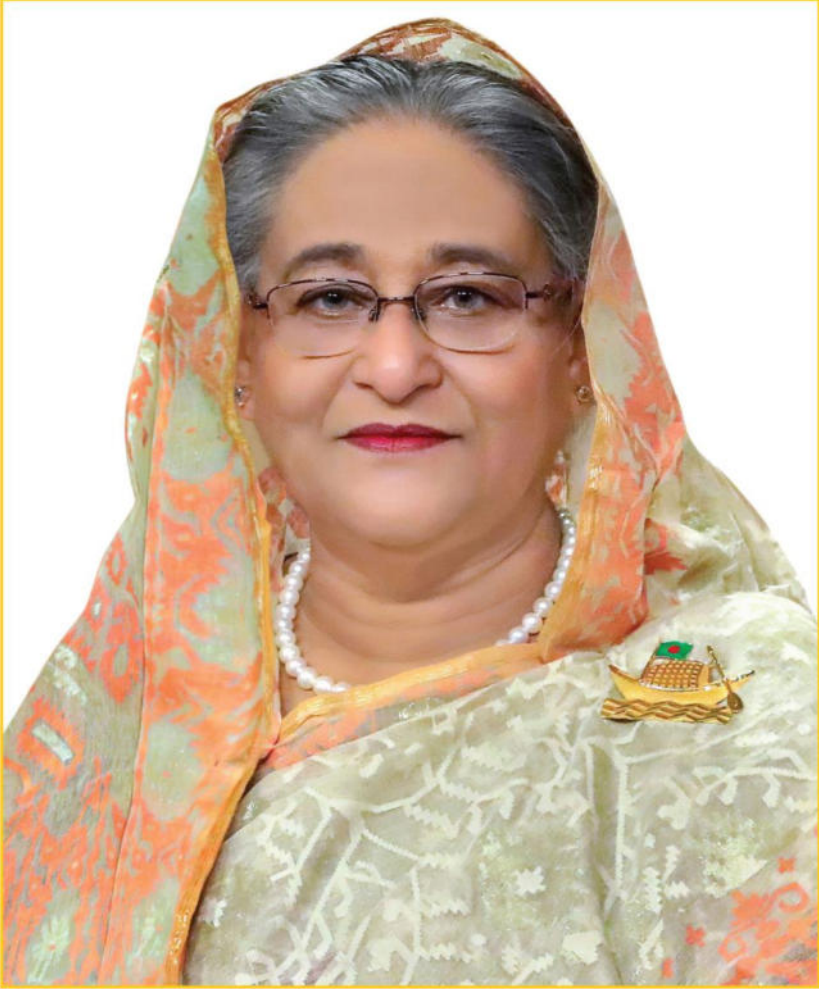
শেখ হাসিনা মাননীয় প্রধানমন্ত্রী গণপ্রজাতন্ত্রী বাংলাদেশ সরকার