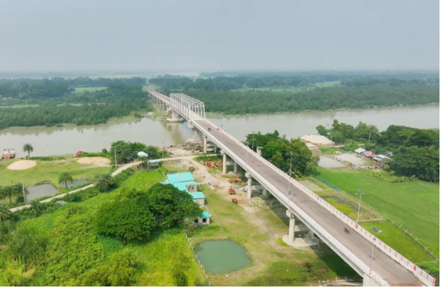
কচুয়া-বেতাগী-পটুয়াখালী-লোহালিয়া-কালাইয়া সড়কের ১৭তম কিলোমিটারে (জেড ৮০৫২) পায়রা নদীর উপর সেতু নির্মাণ প্রকল্প