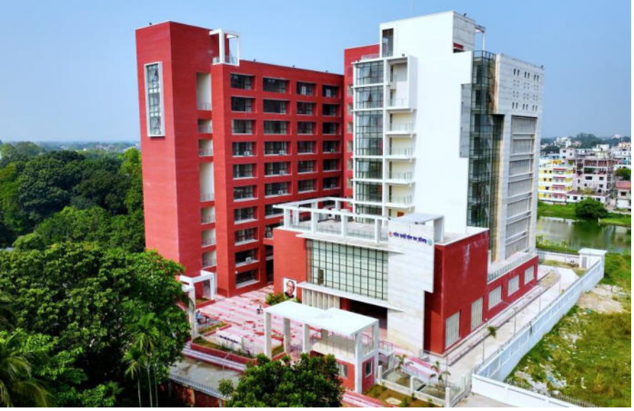
মানিকগঞ্জে বহুতল বিশিষ্ট সমন্বিত সরকারি অফিস ভবন নির্মাণ