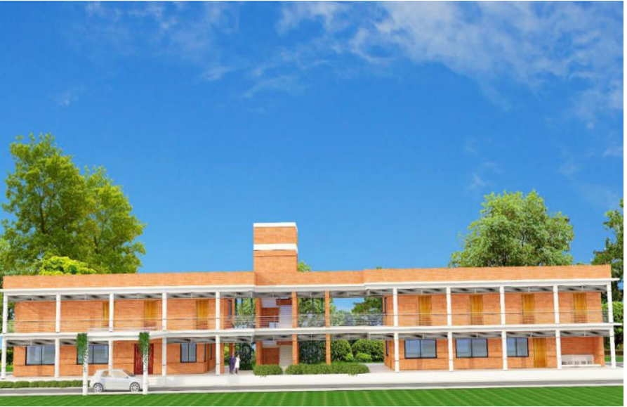
নেত্রকোণা জেলার মোহনগঞ্জ উপজেলায় আদর্শনগর পর্যটন কেন্দ্র