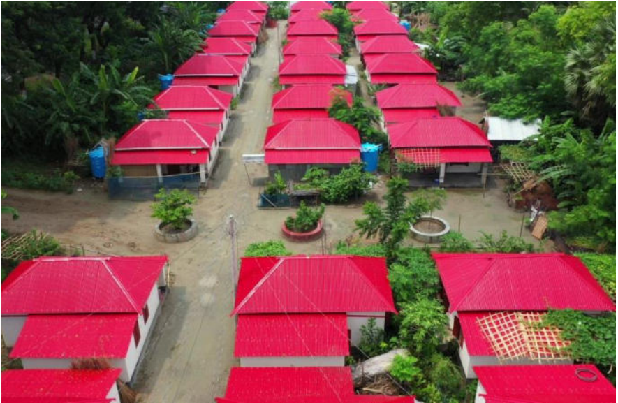
আশ্রয়ণ- ২ প্রকল্পের দৃষ্টিনন্দন সেমিপাকা একক ঘর