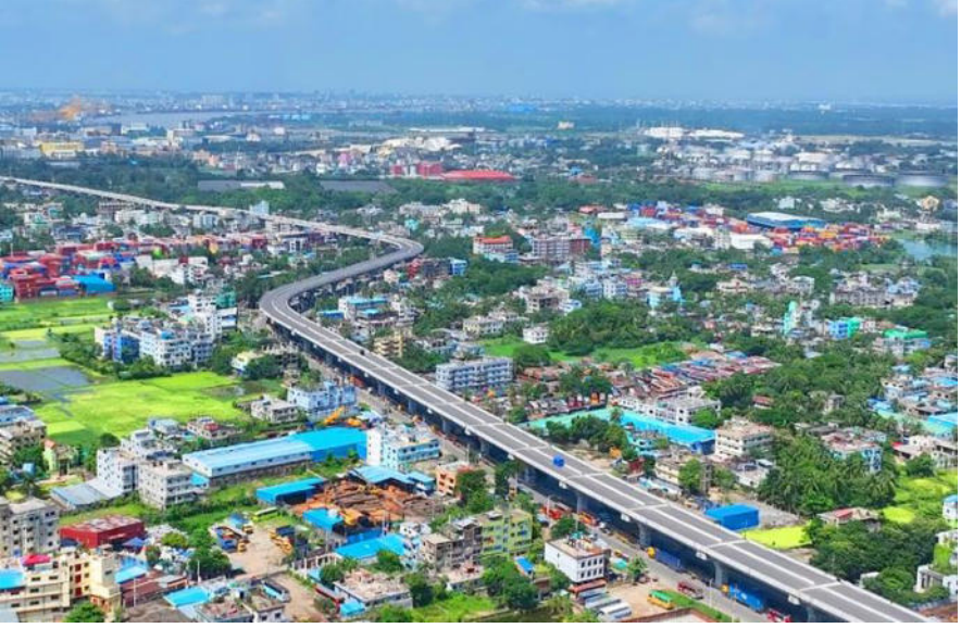
চট্টগ্রাম শহরের লালখান বাজার হতে শাহ আমানত বিমানবন্দর পর্যন্ত মেয়র মহিউদ্দিন চৌধুরী সিডিএ এক্সপ্রেসওয়ে