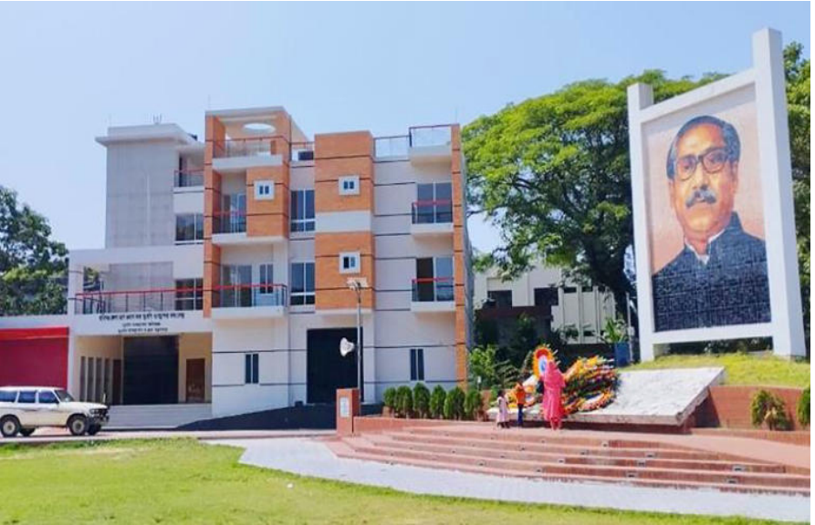
হবিগঞ্জ জেলা ত্রাণ গুদাম কাম দুর্যোগ ব্যবস্থাপনা তথ্যকেন্দ্র