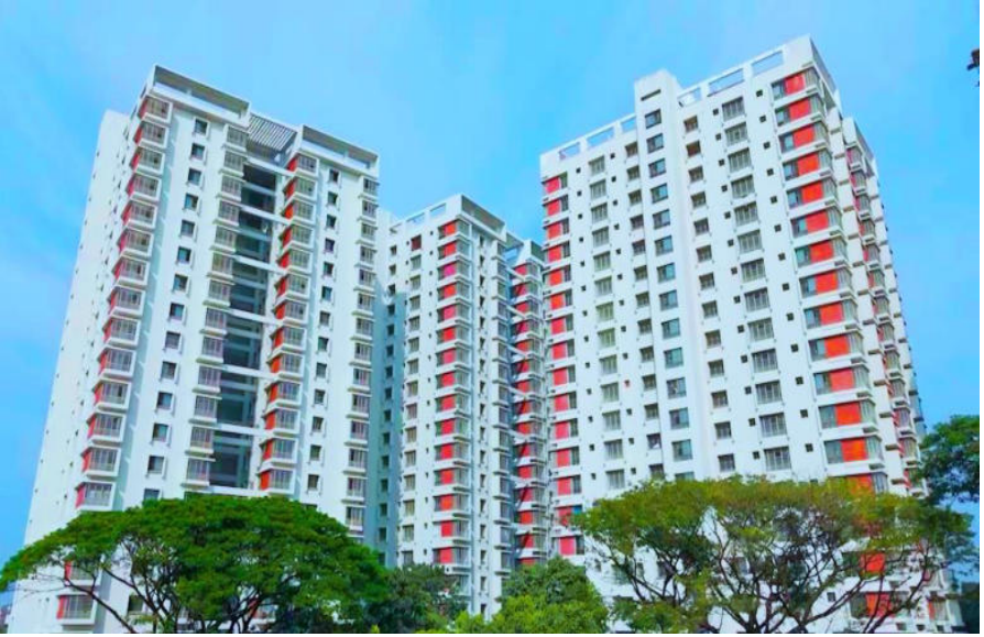
ঢাকাস্থ আজিমপুর সরকারি কলোনীর অভ্যন্তরে সরকারি কর্মকর্তাদের জন্য বহুতল আবাসিক ফ্ল্যাট নির্মাণ