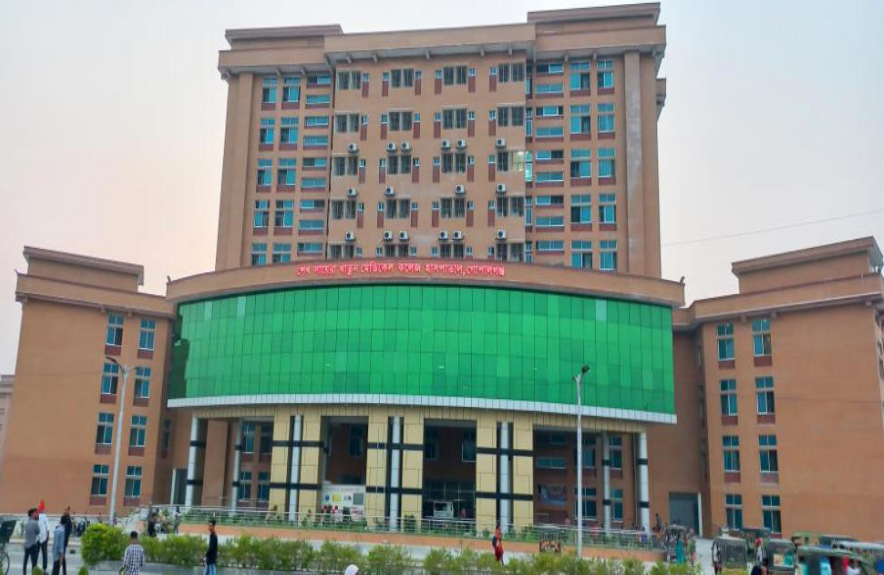
শেখ সায়েরা খাতুন মেডিকেল কলেজ হাসপাতাল, গোপালগঞ্জ