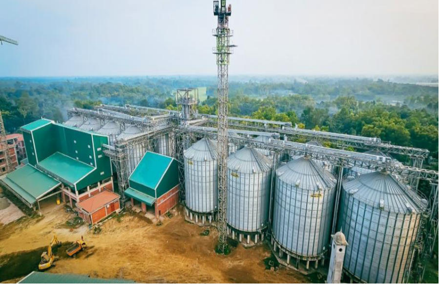
মধুপুর স্টিল রাইস সাইলো