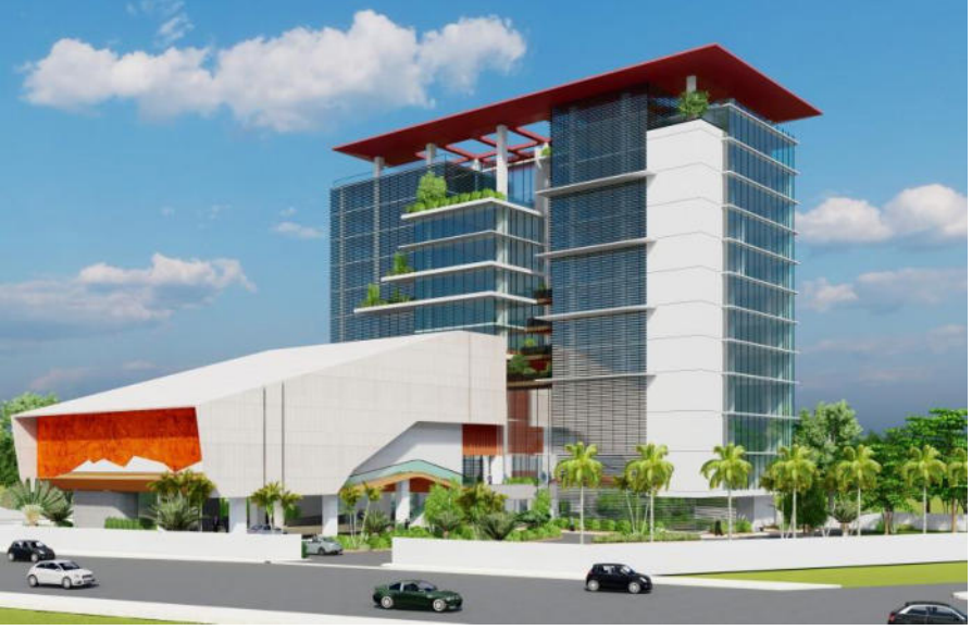
বাংলাদেশ কলেজ অব ফিজিশিয়ানস্ এন্ড সার্জন এর আধুনিকায়ন