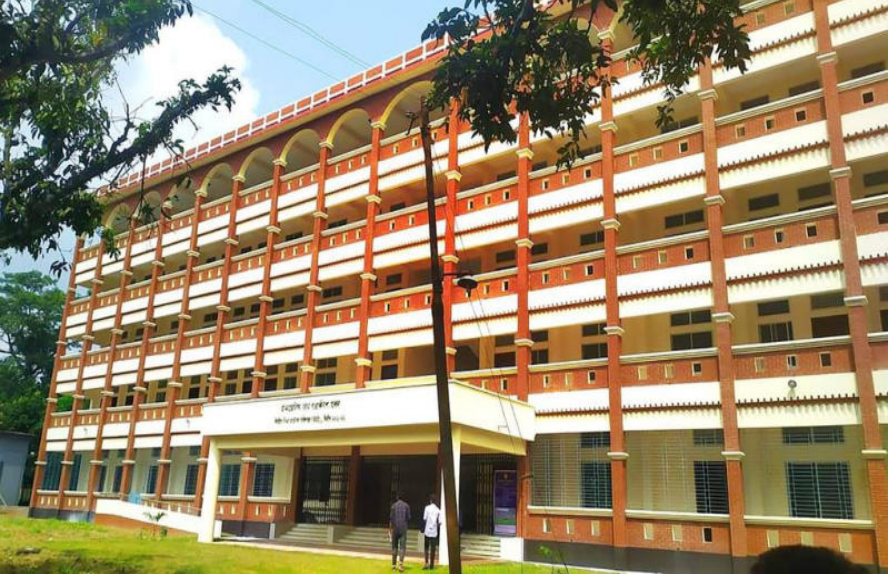
চাঁপাইনবাবগঞ্জ টেকনিক্যাল স্কুল ও কলেজের একাডেমিক কাম-প্রশাসনিক ভবন