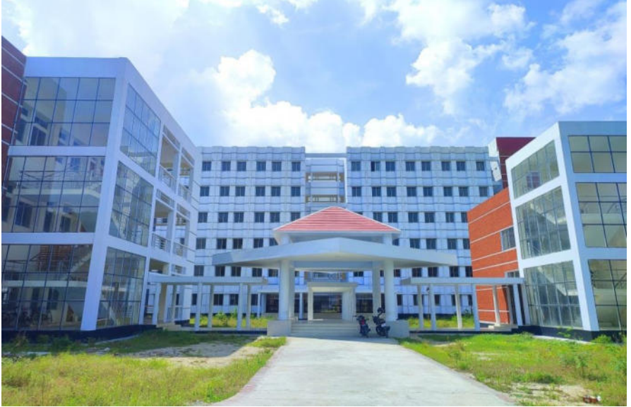
হাজী মোহাম্মদ দানেশ বিজ্ঞান ও প্রযুক্তি বিশ্ববিদ্যালয়ের নবনির্মিত ৬৯৬ আসনের ছাত্রী হল